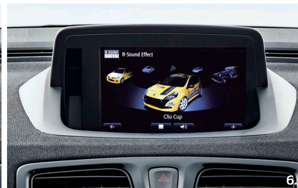
1. Osciloscopio. 2. Curva de potencia y par motor. 3. Fuerza G. 4. Tiempo de vuelta. 5. Gráfico de barras. 6. R-Sound