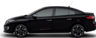
Negro Nacré (676)