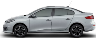
Blanco Glaciar (369)